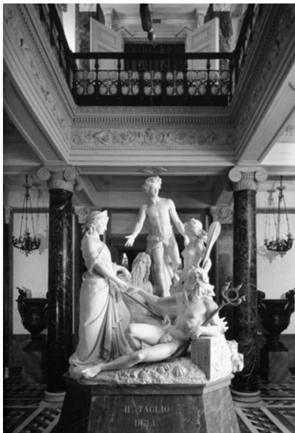
Enteriőr Pietro Magni szoborcsoportjával

A távolba tekintés terelte el a figyelmét a korszak triezsi művészeiről, akik között számos eredeti személyiség volt. A viszonyítási alapot természetesen számukra is az olasz kultúra jelentette immár, de mindannyian vagy szinte mindannyian München vagy Bécs akadémiáin tanultak az első világháború előtt, és olyan közegben éltek, amelyben továbbra is hatott a közép-európai kultúra. A húszas években különösen kiemelkedő időszak kezdődött. Az irányvesztés, a zűrzavar, a jövőtől való félelem termékeny szorongássá alakult a kor művészeiben és szellemi embereiben. Triest kávéháza költők és festők találkozóhelyei lettek, ahol hosszan vitatkozhattak politikáról és művészetéről. A művészek, Vittorio Bolaffio, Ruggero Rovani, Carlo Sbisà, Arturo Nathan, Vito Timmel mellett ott ült az író Italo Svevo, a költő Umberto Saba, de Edoardo Weiss is, Freud tanítványa, az olasz pszichoanalitikus mozgalom megalapítója, aki különösen a terápiás célból festeni kezdő Arturo Nathan személyiségére volt nagy hatással. Az önelemzés és a gondolatok összevetésének igénye, még ha az csak egy kávéházi asztal mellett történt is, természetesen egyfajta identitásvesztésből fakadt: egyelőre a triezsi