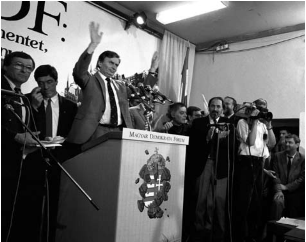
Az első szabad választás után