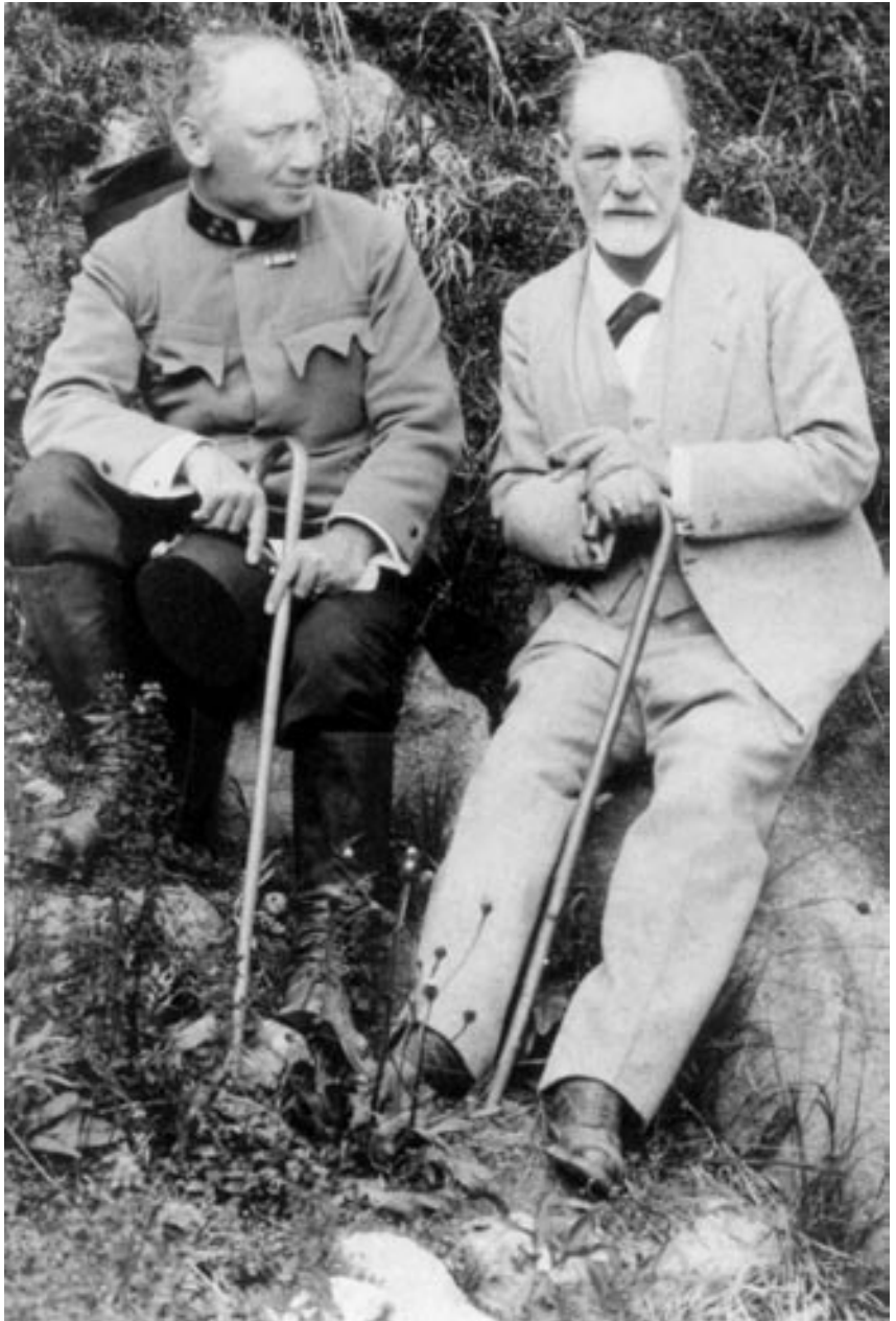
Ferenczi Sándor és Sigmund Freud, 1917

A levelezés önmagában is monumentális teljesítmény volt: Freud és Ferenczi 1908 és 1933 között bizonyos időszakokban naponta többször is váltottak levelet. A teljesítmény azonban nem pusztán a levelek mennyisége, hanem azok tartalma, minősége szempontjából is egyedülálló. Bár sem Freud, sem Ferenczi nem volt hívatásos író, levelezésük – két rendkívül művelt, az irodalom és művészet iránt is roppant fogékony közép-európai polgár levelezése – irodalmi műként is felfogható.