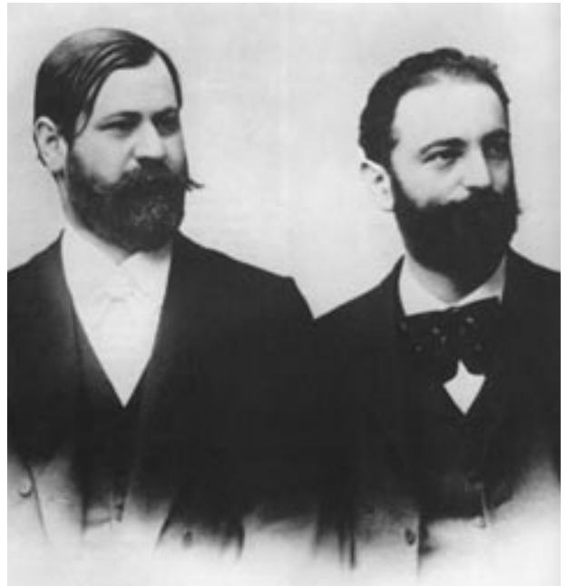
Sigmund Freud és Wilhelm Fliess, Freud ifjúkori barátja az 1890-es évek elején

Az Álomfejtés – mint Schorske kifejti – kulcsjelentőségű mű az Osztrák–Magyar Monarchia szellemi-társadalmi viszonyainak, mentalitásának megértéséhez