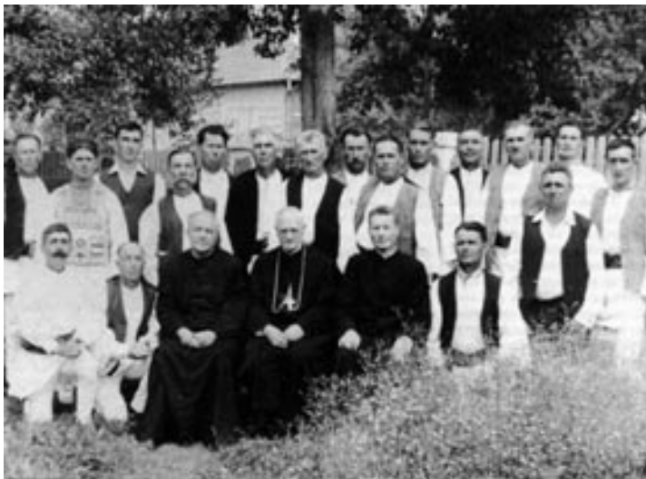
Márton Áron gyimesi csángók között

ki politikus, amely megtartó és oltalmazó ihlet volt mindvégig Márton Áron hosszú szolgálata alatt. A háborús viharban megismert eréllyel és határozottsággal védelmezte az erdélyi magyarságot a Groza-féle ámitások, becsapások, hazugságok korában, majd a nyílt párt-diktatúra évtizedeiben. Mikor az erdélyi magyar közéletet