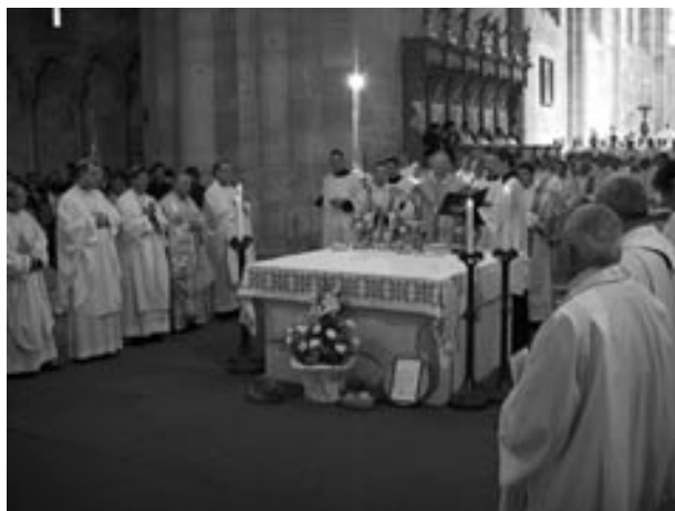
A gyulafehérvári székesegyház búcsúja és Márton Áron püspök halálának 25. évfordulói ünnepsége, 2005. szeptember 29.

Úgy mondják a visszatért papok, hogy Márton Áron hatalmas tekintélye adta vissza a bátorságukat, önérzetüket, hivatástudatukat.