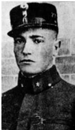
Márton Áron, az első világháború hadnagya

magyar újság egy „elfogott” levelet adott közre, amelyben György Lajos dr. kolozsvári professzor, a Bolyai Tudományegyetem prodékánja arra kéri Teleki Géza grófort, Teleki Pál fiát, az 1944-es moszkvai magyar fegyverszüneti küldöttség tagját, majd az ideiglenes nemzeti kormány miniszterét, hogy térjen vissza Erdélybe – a bécsi döntés után a kolozsvári Ferenc József Tudományegyetemen tanított –, és itt álljon az „elégedetlenek élére”. Vagyis: döntsék meg a moszkvai rendszert. A levél igazi szerzői jól tudták, hogy ezzel súlyos csapást mérhetnek Áron püspökre, akinek György Lajos régi jó barátja volt, 1940-ig együtt szerkesztették az egyetlen romániai