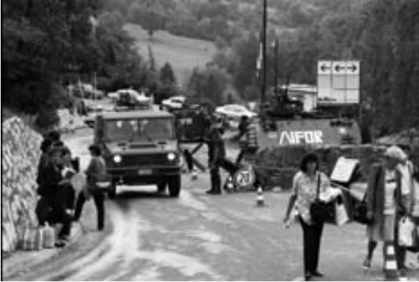
Olasz katonák egy bosnyák-szerb átkelő pontnál Boszniában, Tuzla, 1996. augusztus 12.

a katonai kiadások emeléséről. Nem hiszem, hogy okos dolog lenne bármely szövetséges részéről a kiadások további csökkentése. Persze nemcsak az a fontos, mennyit költünk, hanem az is, hogy mire. Tagadhatatlanul az a helyzet, hogy ma Európában a hidegháborús beidegződések alapján rengeteget költenek régi, elavult szerkezetekre. Sok a felesleges párhuzamosság: a tagországokban hasonló célú katonai akadémiák, támaszpontok, logisztikai rendszerek működnek. A NATO átalakításának egyik fő célja, hogy költséghatékonyabban működjünk közös befektetések, több ország hasonló programjainak összefogása, közös tervezése alapján. Ráadásul miközben Európában a szövetségesek a nemzeti jövedelem átlag 1,9 százalékát költik védelemre, ennek is több mint a felét a személyi állomány fenntartására fordítják, és csupán a negyedénél is kevesebbet új haditechnikára, fejlesztésekre. Ezeket az arányokat változtatnunk kell: túl sok katonát tartunk fegyverben, de kevés közöttük a korszerűen felszerelt. Változtatni kell, főleg az európaiaknak, ha komolyan akarják venni a felelősségüket, méghozzá nemcsak a NATO-ban, ahol már folyik erről a vita, hanem az Európai Unióban is.