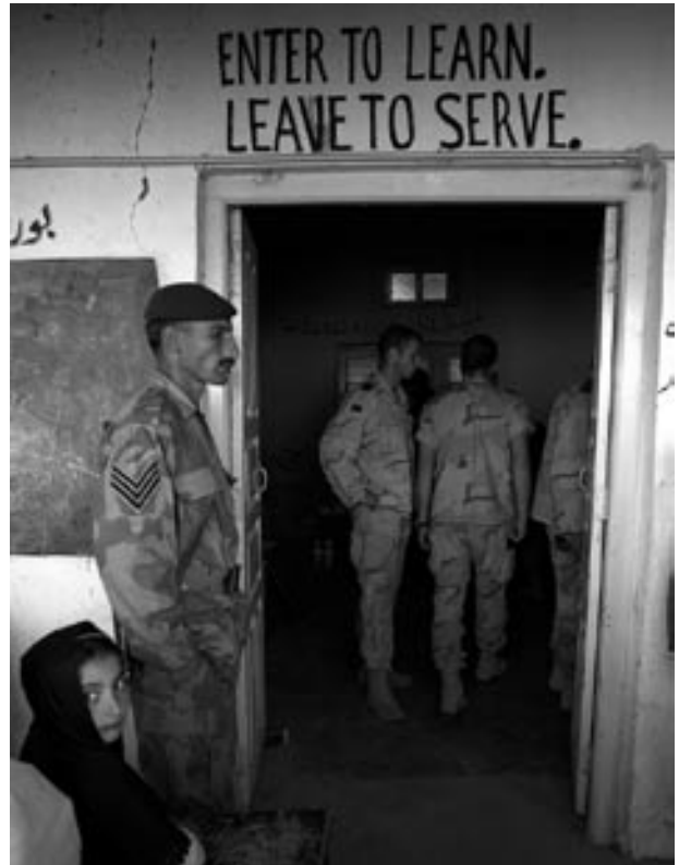
Pakisztáni őrmester őrt áll egy tanterem előtt, amely a férfi járóbetegellátó helye. Benn holland tengerészgyalogosok és a holland haditengerészet orvosai.

– Lehetek őszinte? A régi NATO idején az volt a helyzet, hogy híveink mindenben a híveink voltak, ellenfeleink pedig tűzön-vízen keresztül küzdöttek ellenünk. Mondok egy példát. Az egyetemen jártam egy lánnyal, aki