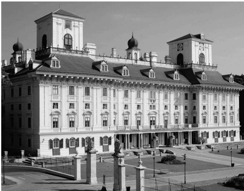
Az Esterházy-kastély Eisenstadtban

Mintha fülkék lennének, egy-egy monitor, mellette fejhallgató. A képernyőn futó film is különleges, oda-szippantja a tekintetet. Felteszem a fejhallgatót, a zene, a csend és a hallható zajok egyszerre új dimenziót adnak a látványnak – kihalt táj, madarak, fa, ember, magány.